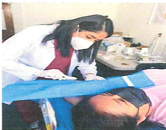
Colocación de Implante Subdérmico Etonogestrel de 1 varilla.